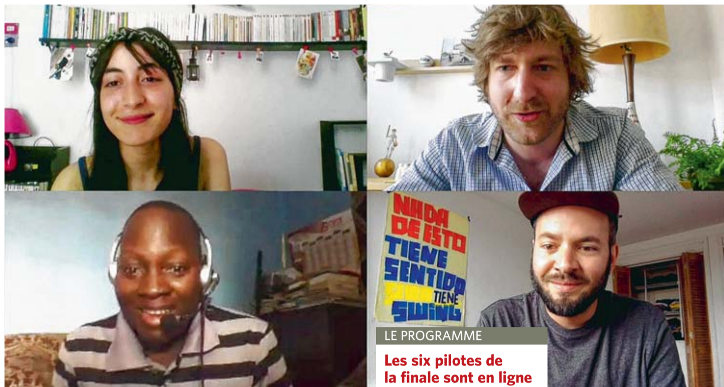
« Tea time club » est un talk-show réalisé à partir des webcams d'internautes aux quatre coins du monde.

VOTE La finale du concours de programmes ce mardi soir